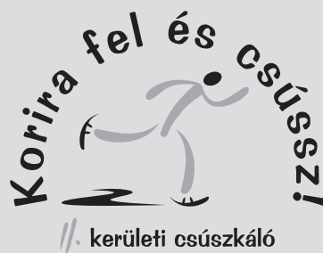
VARASDY IVÁN GRAFIKÁJA

Korira fel és csússz! címmel rendezik meg a II. kerületi csúszkálót február 24-én 9-13 óra között a Városligeti Műjégpályán. A kerületi óvodásoknak és iskolásoknak megrendezett ingyenes jeges napon lesz korcsolyaoktatás, műkorcsolya- és gyorskorcsolyabemutató, sport- és ügyességi versenyek, tombola. A jeges napra mindenkit forró teával és meglepetésekkel várnak. A csúszkálóra jelentkezni a II. kerületi óvodákon és iskolákon keresztül lehet.