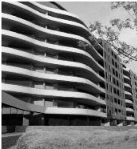
A nyertes pályázat látványterve

A Budapesti Világörökségért Alapítvány a Fővárosi Közigazgatási Hivatalnál az Excelsior Budapest Spa lakóház építési engedélye ellen fellebbezést nyújtott be. A hivatal a keresetet elutasította, mivel az alapítvány nem tekinthető ügyfélnek. Az alapítvány beperelte a Közigazgatási Hivatalt, így az ügy még nem zárult le.