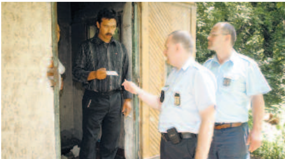
Három közterület-felügyelő tart ügyeletet áprilistól Pesthidegkúton. Feladatuk lesz a járőrözés is