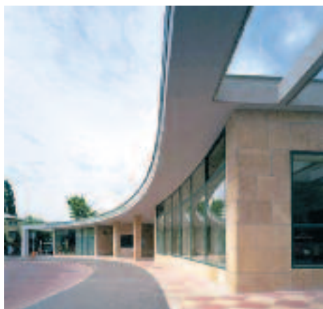
Megszűnik a Pasaréti téren a végállomás — az 5-ös busz a Kelemen László utcán át a Hűvösvölgyig járna a tervezet szerint